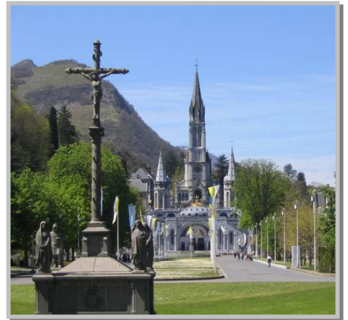
Santuario de Lourdes

Desayuno en el hotel. Por la mañana visitaremos la Basílica de la Inmaculada de Concepción (Santa Misa). La gruta, lampadarios, piscina, museo de Santa Bernardita y el Museo de las curaciones milagrosas. Veremos la procesión de los enfermos e iremos al vía crucis. Tarde quedara libre. Cena y alojamiento en hotel de Lourdes.