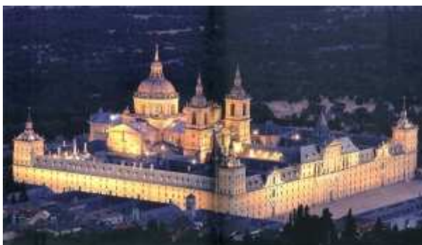
El Monasterio de San Lorenzo del Escorial