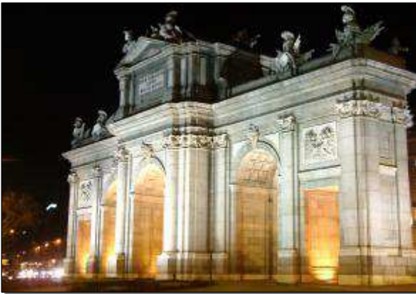
Puerta de Alcalá - Madrid

Llegada a Madrid. Después de pasar por las oficinas de Migración y aduanas nos trasladaremos al hotel, para registrarnos y dejar nuestro equipaje. Luego haremos una visita panorámica de la ciudad, donde observaremos los lugares más importantes de ella. Luego visitaremos la Catedral de Almudena en Madrid que es el Santuario de Nuestra Señora de la Almudena. Según la leyenda, fue traída a Madrid en tiempos Apostólicos por un discípulo de Santiago, Calosero, y su imagen fue tallada por Nicodemo y pintada por San Lucas. En este lugar o en un salón del hotel tendremos nuestra Santa Misa. Cena y alojamiento en un hotel de Madrid.