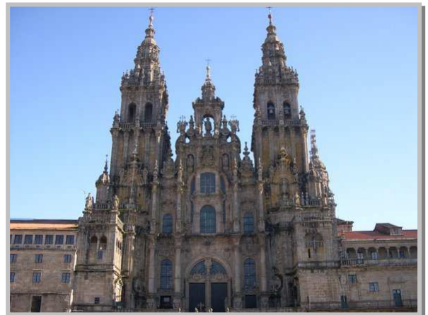
Catedral de Santiago de Compostela

Desayuno en el hotel. Hoy realizaremos una visita a todos los lugares relacionados con las apariciones de la Virgen María en el año de 1917 a los tres pastorcillos, Jacinta, Francisco y Lucía. Visitaremos sus casas en la pobre aldea de Aljustrel y Valinhos, la Iglesia parroquial de Fátima donde se bautizaron. Visitaremos también la capilla de las apariciones y la gran Basílica. Misa en Iglesia de Fátima o en la Capilla de Las Apariciones. Por la tarde saldremos de Fátima a Santiago de Compostela. Cena y alojamiento en hotel de Santiago.