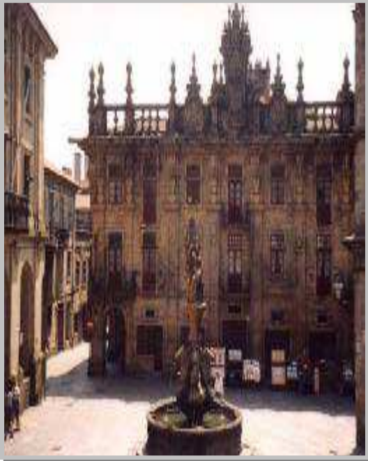
Plaza de las Platerías en Santiago

Desayuno en el hotel. Por la mañana visita a pie de esta incomparable ciudad, uno de los conjuntos monumentales mas extraordinarios de España. Destacamos la Catedral (lugar de Santa Misa y donde observaremos la ceremonia del Botafumeiro), Universidades y Plazas. Es a partir del siglo IX cuando se inician las primeras peregrinaciones para visitar la tumba del Apóstol, cuyos restos llegaron a costas Gallegas procedentes de Palestina, convirtiendo a Santiago y su camino desde entonces en un centro religioso y cultural de referencia en toda Europa. Es usual visitar la tumba del Apóstol. En la cripta esta el sepulcro de Santiago y sus discípulos Atanacio y Teodoro. Las reliquias reposan en una urna de plata con el anagrama de Cristo (Crismón) en la tapa. Es tradicional subir al camarín del Apóstol, donde Santiago aguarda las oraciones de los Peregrinos desde la consagración del templo en el año de 1211. Luego visitaremos el Claustro de las Carmelitas y de los Franciscanos. Y por la noche ver y escuchar la Estudiantina de Santiago. Cena y alojamiento en el hotel de Compostela.