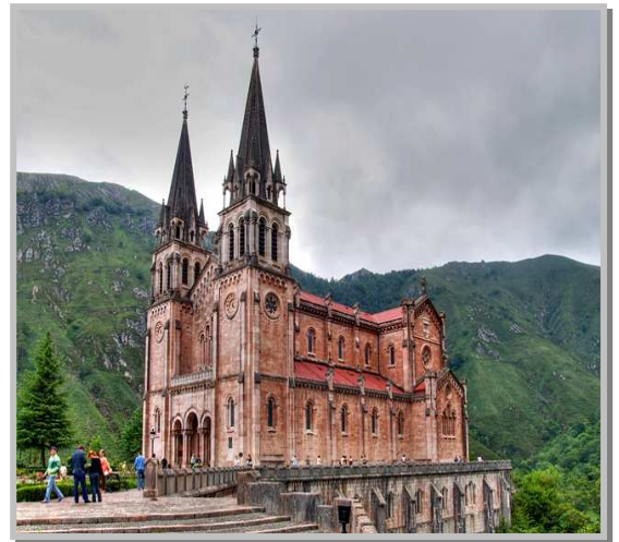
Santuario de Covadonga

Desayuno en el hotel. Por la mañana temprano salida hacia Covadonga, donde se encuentra el Santuario de nuestra Señora de Covadonga. Este Santuario esta en el Parque Nacional Picos de Europa, ahí enclavado en la mitad de la montaña se haya el Santuario de Nuestra Señora de Covadonga y la imagen de la Virgen denomina por el pueblo como "La Santina" . Los primeros datos sobre el culto y devoción a nuestra Señora en el recinto de la Santa Cueva, proceden del Reinado de Felipe II. Cuenta la historia que en ese mismo lugar del Santuario y amparados por la Virgen, se enfrentaron las tropas Cristianas contra los árabes en el año 722 DC. Los cristianos amparados por la Virgen vencieron y esto lleno de entusiasmo y esperanza a la Cristiandad y dio comienzo a lo que con el tiempo se llamaría la reconquista. Por la tarde partimos a Santander. Cena y alojamiento en Santander.