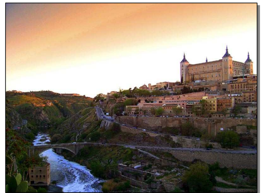
Atardecer en Toledo

Desayuno en el hotel. Partimos temprano para dirigirnos a la que fuera la antigua capital del Imperio Español, Toledo. Visitaremos la Catedral Gótica de Santa María (Santa Misa) donde entre otras pinturas veremos unas del Greco, además visitaremos otros monumentos como Iglesias, Mezquitas y Sinagogas que presentan a las tres religiones que han pasado por España. Cena y alojamiento en hotel de Madrid.