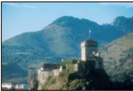
El Castillo de Lourdes

Por otro, el Pico del Jer , reconocible por una gran cruz que se ilumina al caer la noche. Se puede acceder a la cima a través de un funicular, que va ofreciendo al pasajero unas vistas increíbles. Desde lo alto, se observan los Pirineos, Lourdes, Pau y Tarbes.