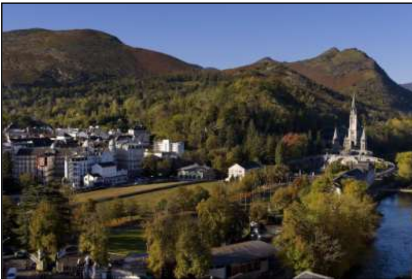
Panorámica del Santuario de Lourdes y la ciudad

Llegada a Lourdes y visita del santuario. El Santuario de Lourdes, lugar cosmopolita de fe, es uno de los destinos marianos más visitados del mundo. Se encuentra situado en la pequeña ciudad de Lourdes (unos 15.200 hab. aproximadamente), en la región de Hautées Pyrénées (Altos Pirineos), dentro de un valle rebosante de verdor y fresca. Los bellos paisajes , la naturaleza , la tranquilidad , el relax y sobre todo la fe y devoción en la Virgen de Lourdes son características que acompañan el modo de vida de esta zona.