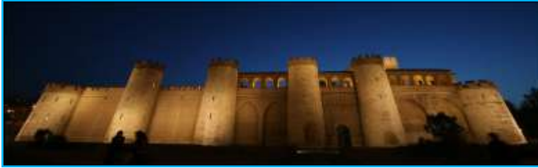
Palacio árabe de La Aljafería

Se recomienda escaparse a ver el Alma Mater Museum y el Museo de Tapices , que alberga una de las colecciones más importantes del patrimonio artístico español.