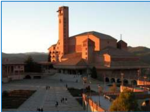
Vista general del Santuario y la Explanada

Su privilegiada ubicación hace que cuente con un hermoso entorno y una maravillosa panorámica del embalse de El Grado. Conocido como el Santuario de las Familias , Torreciudad es hoy un lugar de reunión y peregrinación para miles de personas. El conjunto (explanada, santuario y edificios anexos) resulta una obra de arte arquitectónico de singulares características, de estilo muy personal y vanguardista.