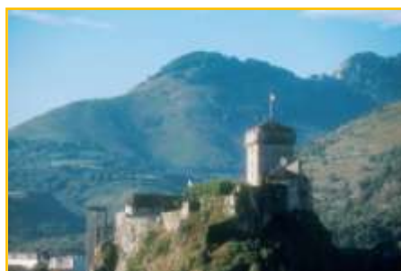
El Castillo de Lourdes

Por otro, el Pico del Jer , reconocible por una gran cruz que se ilumina al caer la noche. Se puede acceder a la cima a través de un funicular, que va ofreciendo al pasajero unas vistas increíbles. Desde lo alto, se observan los Pirineos, Lourdes, Pau y Tarbes.