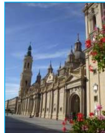
Santuario de Ntra. Sra. del Pilar

Traslado al hotel y almuerzo en el lugar seleccionado.