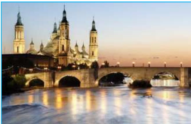
Vista desde el río Ebro: Basílica del Pilar y Puente de Piedra (s. XIV)

Llegada a Zaragoza y visita del Santuario del Pilar, situado a orillas del Ebro, uno de los más importantes del mundo católico hasta el que llegan anualmente millones de peregrinos y gentes venidas de todos los rincones. Ubicado en el mismo centro de Zaragoza , el Pilar es parada obligada para todo aquel que llega hasta la capital aragonesa. El templo, resultado de diferentes trabajos, es una joya del barroco aragonés. Su interior, un auténtico museo que nos muestra obras como el impresionante retablo plateresco de Damián Forment , la Santa Capilla que guarda el tesoro más preciado, la imagen de la Virgen del Pilar, o las cúpulas pintadas por el genial pintor Francisco de Goya .